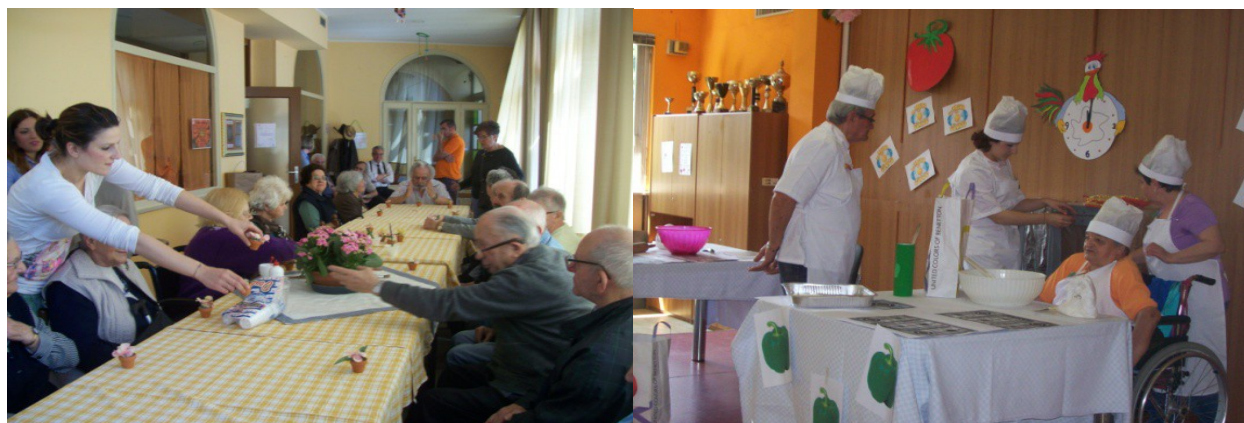
In visita dagli amici di Carpignano

Ecco quindi le testimonianze fotografiche delle nostre uscite