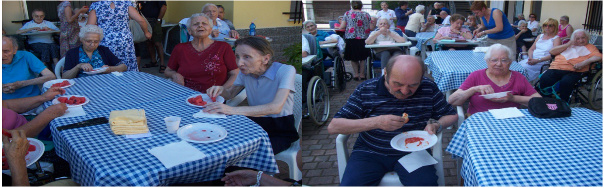
Festa a tema, anguria per tutti!!