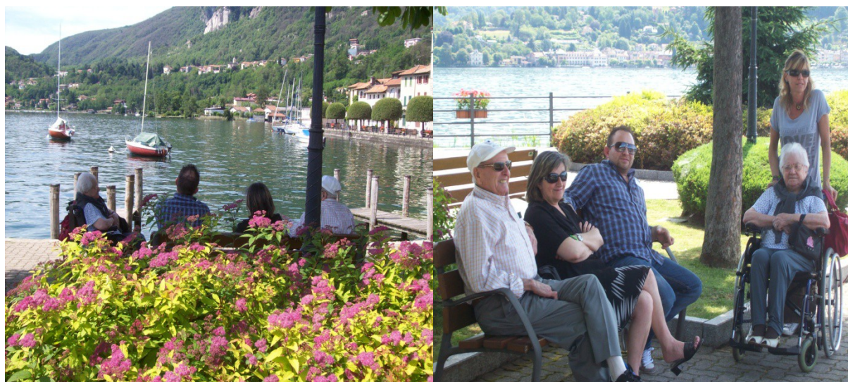
Gita al lago d'Orta