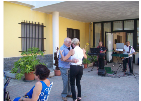
Balli e musica dal vivo