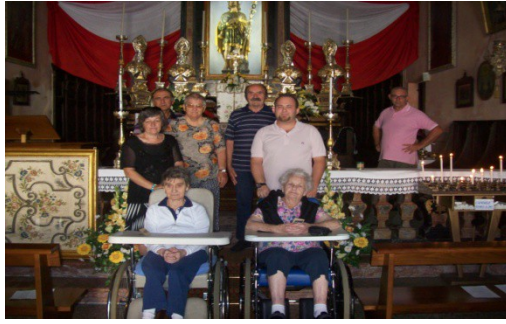
Chiesa di S. Rocco Borgolavezzaro