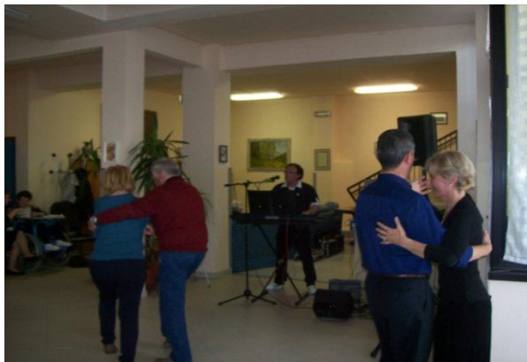
Esibizione di tango argentino